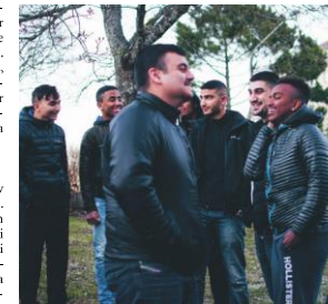
AV UNGA FÖR UNGA. Så beskriver Ung Arena sig själva. "Vi vill vara förebilder för de yngre, hjälpa dem bryta självdestruktiva mönster".

– Göra våra områden bättre. Jag vill att våra familjer ska vilja bo här i framtiden också, att när jag får barn ska de växa upp i ett bra område, säger